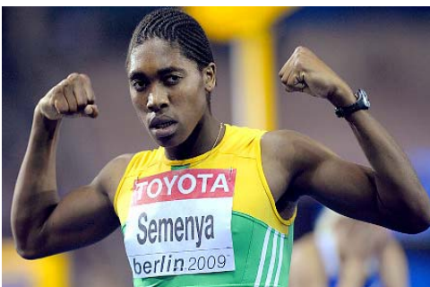
Caster Semenya vinner vid VM i Berlin

Varje gång friidrotten samlas för större tävlingar brukar det resultera ett antal skandaler. Ingen annan idrott tycks ha så stora problem med den idrottsliga etiken som friidrotten. Dopingskandalerna avlöser varandra hela tiden. När de inte gör det ligger misstankar ändå hela tiden och bubblar under ytan. En ständig förtroendekris tycks råda.