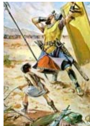
I enstaka fall kan David knäppa Goliat på näsan, även om det är sällsynt

Det finns också exempel på att idrottare drar vinstlotter i det genetiska lotteriet. Jönsson berättar om den finske skidlöparen som hade en genetisk egenskap, vilken gav honom så stor syreupptagningsförmåga att han misstänktes för dopning. Det visade sig senare att då man undersökte släktingar till honom, att