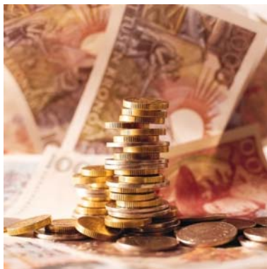
Pengar ger också muskler

Det är med andra ord inte så himla lätt ens ur ett filosofiskt perspektiv. Ur denna synvinkel tror jag inte heller att någon absolut och vattentät rättvisa, i betydelsen lika möjligheter, är möjlig att uppnå. Rättvisa är ett begrepp, precis som jag tidigare visat om sanning , som är påhittat av människor. Vad det sedan är, beror på vad vi själva lägger i det. Det finns ingen universellt given rättvisa.