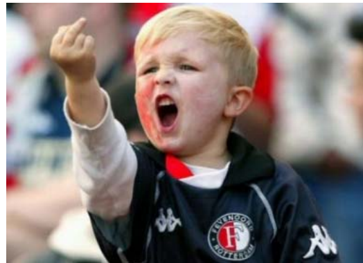
Utstrålar inte precis ädelt gentlemannaskap

”Idrotten står för ädel tävlan och gentlemannaskap” . Det är svårt att hitta exempel på detta. Friidrott, skidor, m.fl. idrotter framstår mera som rena apotekarmästerskap än ädel tävlan. Om en fotbollsspelare i italienska ligan blir stående på bägge benen inom straffområdet i stället för att filma att han blivit nerdragen, är han inte med i laget mera. Fotbollsspelare är utmärkta skådespelare nu för tiden. Den vansinnigt upphaussade fotbollen har ett dominerande inflytande på idrottens anseende. Det är säkert inte bra. Den gravt förståndshandikappade svans av supportrar kring fotbollen ger den en klar ligiststämpel.